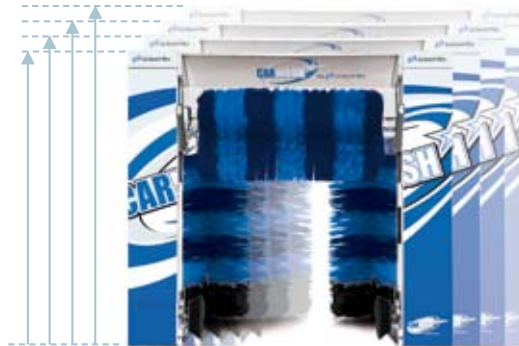
EVO R CARWASH