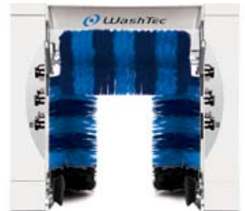
EVO R BASIC